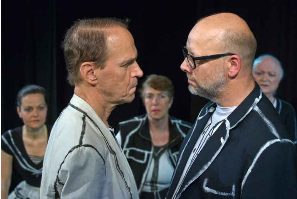
Szenenbild Berliner Compagnie — Das Bild vom Feind 15.11.20.00 h KH

Die Friedenswochen werden vorbereitet, gestaltet und finanziell getragen von folgenden Organisationen: Bündnis 90 / Die Grünen - Stadtverband Bad Kreuznach; Deutsche Friedensgesellschaft – Vereinigte Kriegsgegner - Bad Kreuznach; DKP Bad Kreuznach; Die Linke - Bad Kreuznach; Netzwerk am Turm e.V.; Pfarramt für Ausländerarbeit im Kirchenkreis An Nahe und Glan; Synodalbeauftragter für Frieden und Gerechtigkeit im Kirchenkreis An Nahe und Glan; VVN-Bund der Antifaschisten - Kreisgruppe Bad Kreuznach; Weltladen Bad Kreuznach